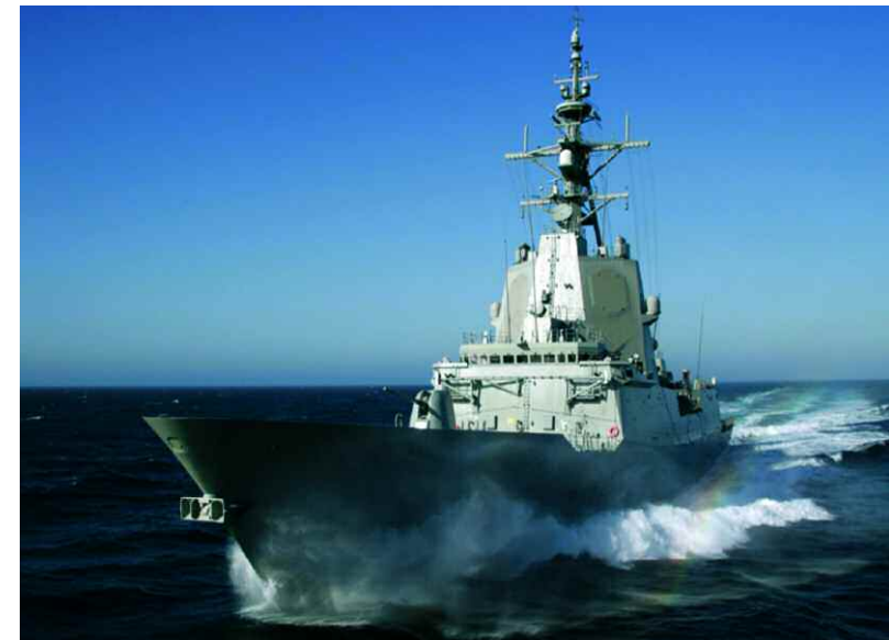
Programa Fragatas F-100 : Sistema de Combate AEGIS. Una Decisión Acertada.