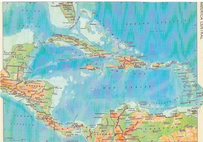
El Mar Caribe.

El Océano Atlántico, a la altura del Trópico de Cáncer, vierte sus aguas en el gran saco antillano. Este, salpicado de islas, es un gran entrante en la costa americana que divide en dos el Nuevo Continente. Abarca dos espacios marítimos diferenciados: el Golfo de Méjico y el Mar Caribe. A este último prestaremos únicamente nuestra atención.