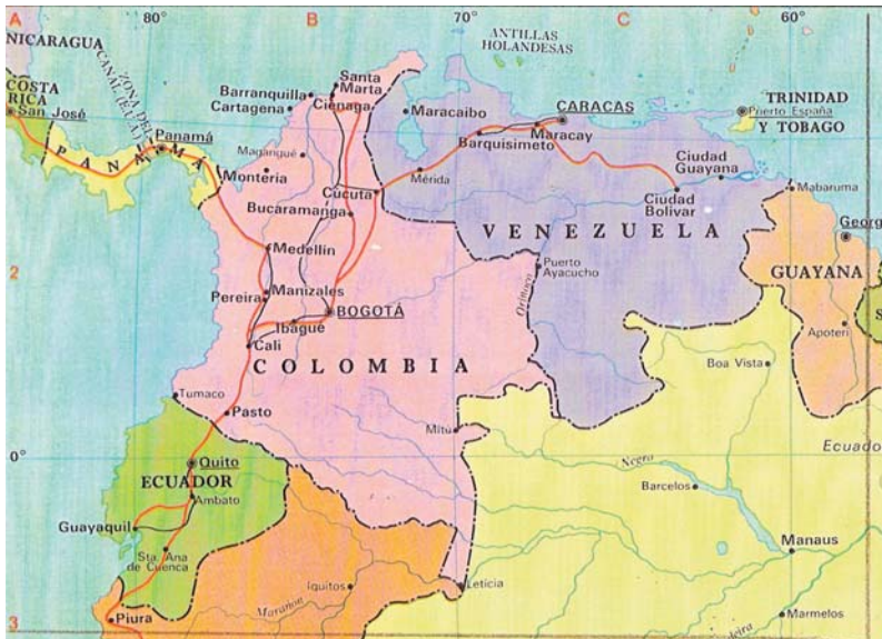
Colombia y Venezuela

El Salvador, tiene el discutible honor de ser uno de los albergues preferidos de la banda criminal internacional “Mara Salvatrucha”.