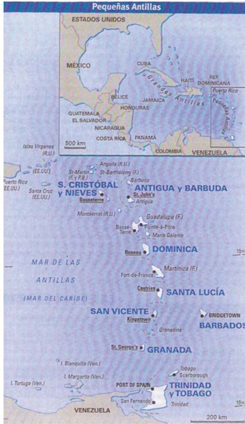
Las Pequeñas Antillas.

El Mar Caribe, subsidiario del Atlántico, ocupa una superficie limitada al oeste por la sinuosa costa de Centroamérica, al sur por la de Sudamérica, al norte por las Grandes Antillas: Cuba, La Española y Puerto Rico y al oeste por una cadena de islas de menor tamaño llamadas las Pequeñas Antillas que en forma de barreda arqueada se extienden desde el este de la de Puerto Rico hasta la isla de Trinidad próxima a la costa oriental venezolana.