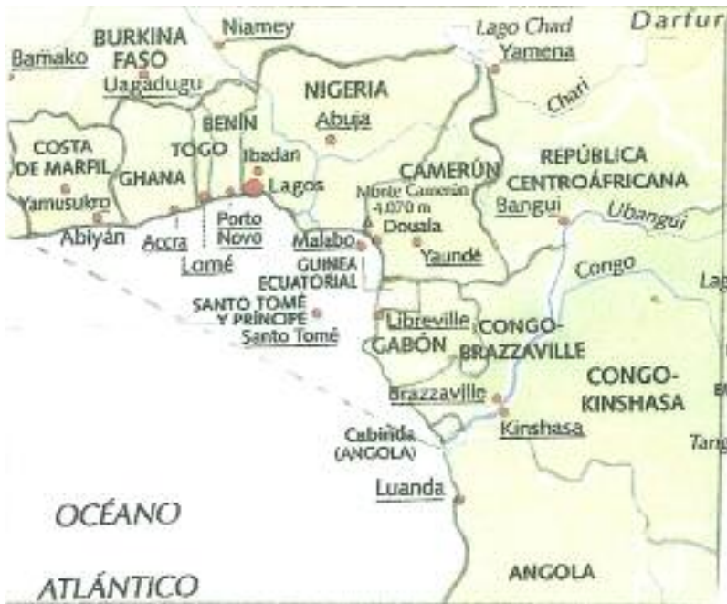
Figura UNO. El Golfo de Guinea

En los seis grados de latitud al norte del Ecuador la costa atlántica africana se extiende de oeste a este doblándose después en ángulo recto en