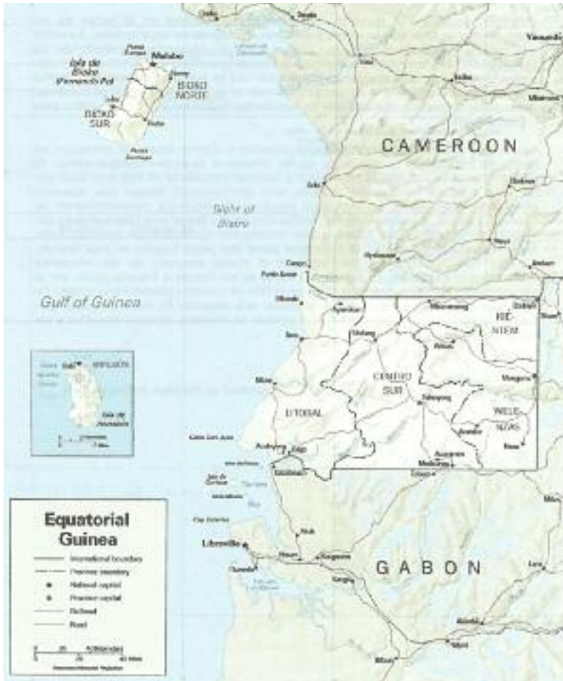
Figura CINCO. Guinea Ecuatorial.

Se compone de una parte continental, Río Muni, rodeada por Camerún y Gabon y varias islas. La principal es la de Bioko (Fernando Poo) situada en la Bahía de Biafra frente a la costa del Camerún. En la Bahía de Corisco que se adentra en territorio gabonés se encuentran las islas de Corisco, Elobey Grande y Elobey Chico y los islotes de Mbañe, Cocoteros y Conga. Ya en el hemisferio sur está la isla de Annobon. El territorio continental tiene una extensión mayor que el insular.