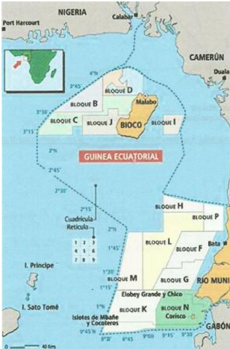
Figura OCHO. Aguas de Guinea Ecuatorial