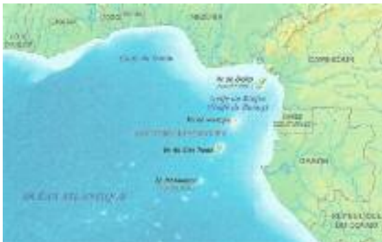
Figura DOS. Bahías de Benin y de Biafra.

Lo primero que resalta a la vista en todo este espacio marítimo-terrestre es que Nigeria, la más extensa potencia regional, ocupa una posición continental dominante.