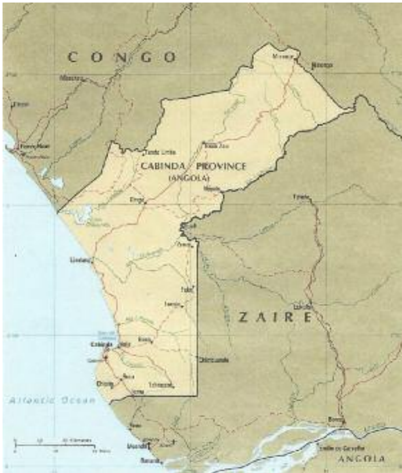
Figura SEIS. Cabinda.