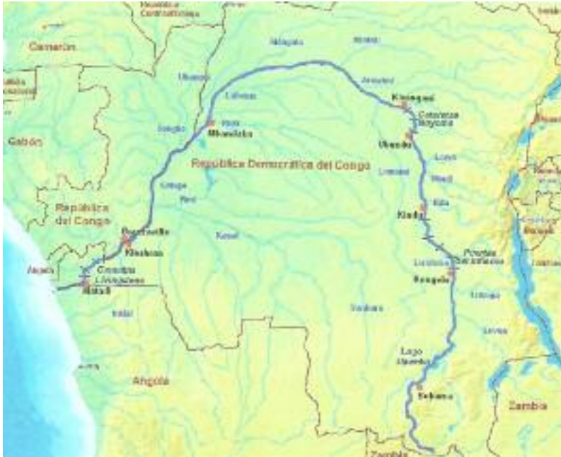
Figura TRES. República Democrática del Congo.

Tanto en el fondo del Golfo dentro de las correspondientes ZME (Zona Marítima Exclusiva) de los países ribereños e insulares como en sus territorios continentales de soberanía se han descubierto importantes yacimientos de petróleo y gas natural que están siendo explotados desde hace años por compañías mixtas internacionales.